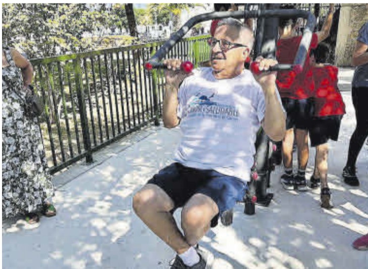
▶▶ Una persona mayor hace gimnasia con uno de los aparatos.