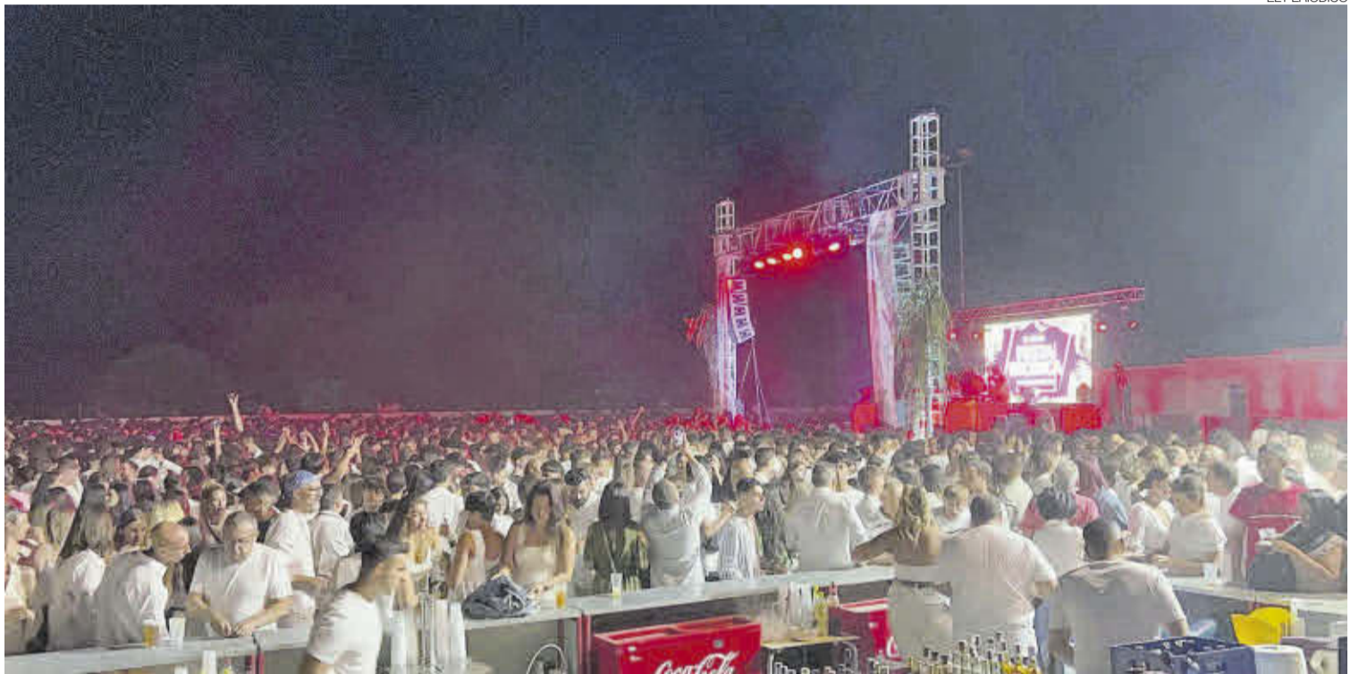
► Un gran escenario con pantalla permitió al público disfrutar de las actuaciones musicales.

Además, destacó el importante retorno económico y promocional que supone el evento, pues a lo largo de la jornada se llenaron los establecimientos hosteleros y distintos comercios. La fiesta celebrada en la plaza de toros, tematizada con estilo ibicenca y a la que los asistentes acudieron vestidos de blanco, acogió la actuación del artista Alex Flow y su grupo de animación, así como distintos DJ's y bailarines. Para garantizar la seguridad de todos los asistentes se puso en marcha un dispositivo de seguridad con más de 50 integrantes entre Guardia Civil, policía local, protección civil, seguridad privada y asistencia sanitaria. ≡