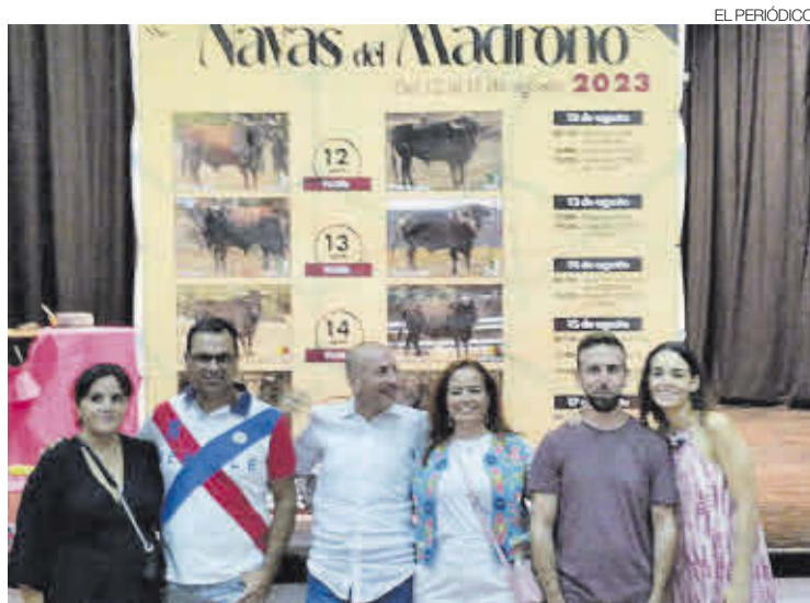
►► Presentación del cartel de toros de Navas del Madroño.

CADA AÑO LAS FIESTAS ATRAEN A NUMEROSO PÚBLICO