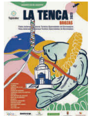
►► Cartel que difunde la fiesta.