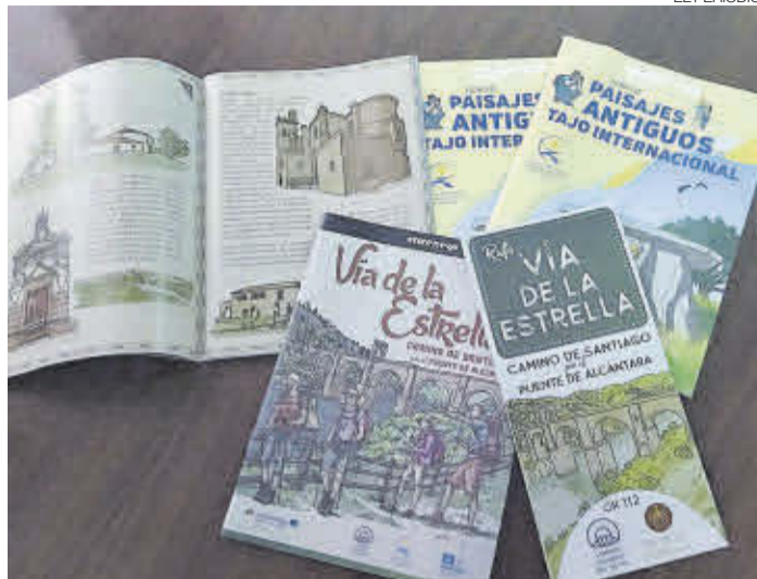
►► Material turístico de promoción de los recursos de Brozas.

Tras una difícil deliberación, el jurado profesional designado por la organización concedió el premio a la mejor tapa al restaurante La Laguna por su elaboración que llevaba por nombre ‘Sorpresa extremeña’, mientras el premio al mejor conjunto de tapas recayó en el bar Las Brozas con ‘Ceviche de langostinos en canasta de plátano macho’ y un ‘Pan de jamón venezolano’. El ayuntamiento destacó la alta participación. ≡