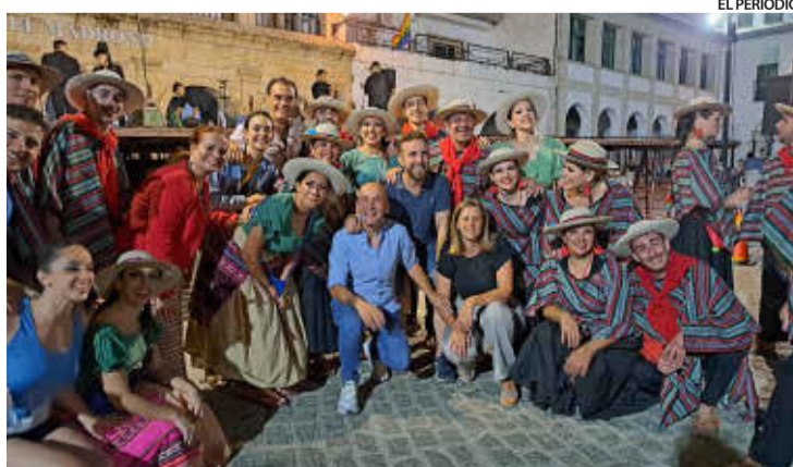
EL PERIÓDICO ▶▶ Acuarelas Americanas puso la nota de color en Navas.