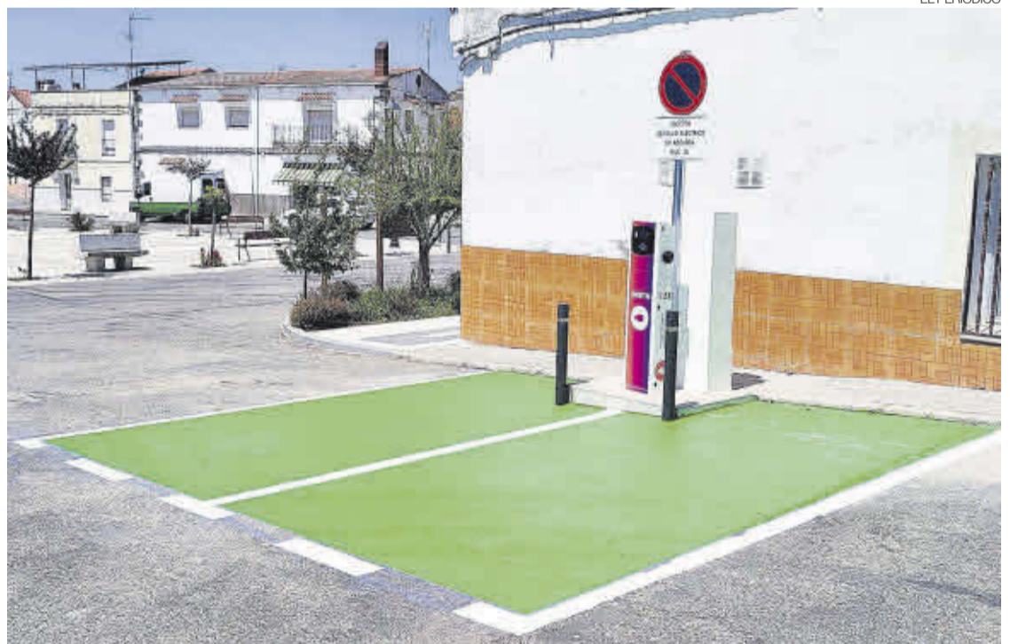
►► Punto de recarga para vehículos eléctricos que ya está en uso en Piedras Albas.

Un punto de recarga se utiliza para cargar un vehículo eléctrico, ya sea coche o moto. Este tipo de vehículos son propulsados por energía eléctrica, la cual se encuentra almacenada en baterías que necesitan ser recargadas cada cierto tiempo, concretamente cuando la autonomía de éstas lle-