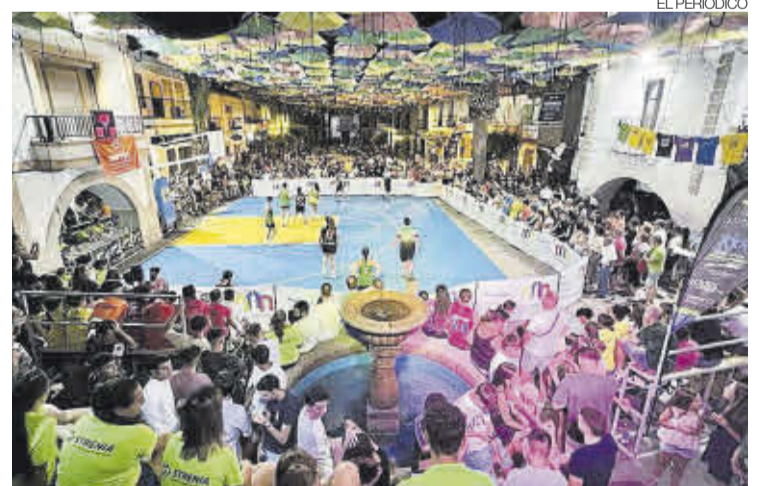
► El torneo de baloncesto en la calle atrajo a numeroso público.

Durante la jornada se jugó el torneo de 3x3, además de concurso de triples y mates. Por otra parte, los más pequeños pudieron disfrutar de un concurso de habilidad y de varios hinchables. El Woka on 3 se proclamó ganador en las dos categorías absolutas, tanto en masculino como en femenino. En la categoría sub-16 masculino ganó Electromercantil. Este evento se ha consolidado como referente del baloncesto regional por la alta participación y por atraer a