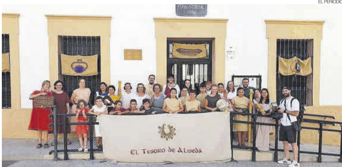
►► Mayores y pequeños se implicaron en las distintas actividades.

Los primeros días se realizaron talleres como el de la elaboración de ungüentos medicinales tartesios, el de escritura tartesia, el taller de elaboración de instrumentos musicales tartesios y otro de elaboración de queso de cabra. Se finalizó con una ruta por los lugares más relevantes relacionados con la historia del descubrimiento del Tesoro. La ruta finalizó en las popularmente conocidas como Tumbas de los Moros, donde estu-