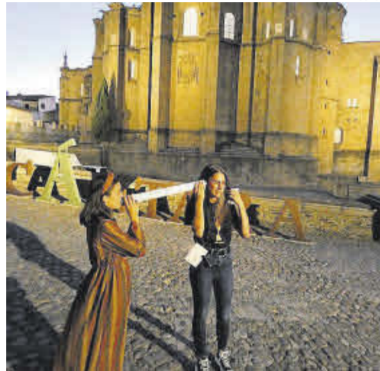
▶▶ Una actriz susurra un verso al oído de una joven

dad que se llevó a cabo durante la 37ª edición del Festival de Teatro Clásico de Alcántara. De esta manera, han sacado del escenario fragmentos de obras clásicas para susurrarlas al oído y encandilar al público asistente. Con tan solo unos tubos de cartón reutilizados, tras días de elaboración de susurradores y ensayos posteriores de los fragmentos de obras, los participan-