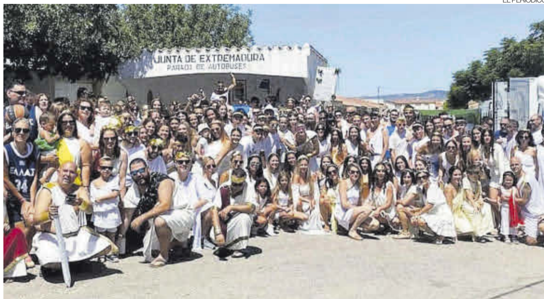
►► Participantes en la tradicional 'Cañas griegas' que abre las fiestas de agosto.

LOS AFICIONADOS A LOS TOROS PODRÁN DISFRUTAR DE LA LIDIA DE SEIS ASTADOS