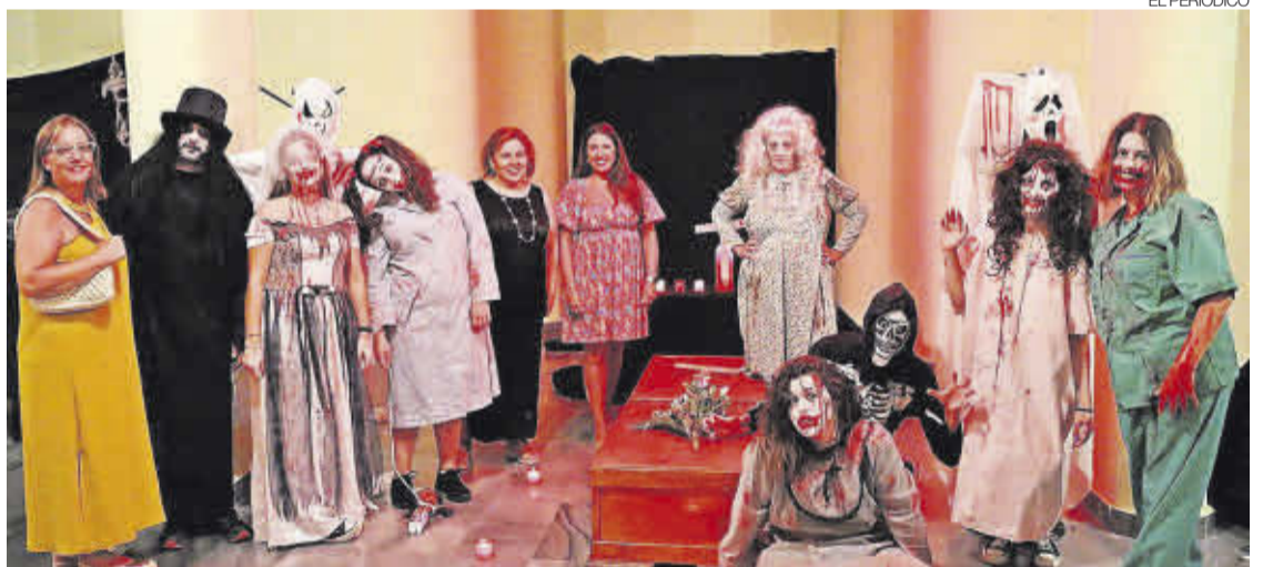
►► Participantes que representaron una escena de terror, junto a autoridades locales.

participación en la Noche del Terror celebrada el 5 de agosto en la que no faltaron el miedo, los gritos y los sustos. La cita congregó a un gran número de personas que acudieron dispuestas a pasar una divertida noche en un terrorífico pasaje en el que se escondían seres terroríficos. También registraron mucho público las proyecciones de los largometrajes y cortometrajes de terror en el Castillo, del 6 al 9 de agosto. ≡