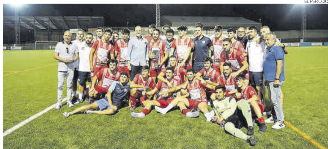
►► Jugadores del Arroyo junto a representantes de Club y alcalde.