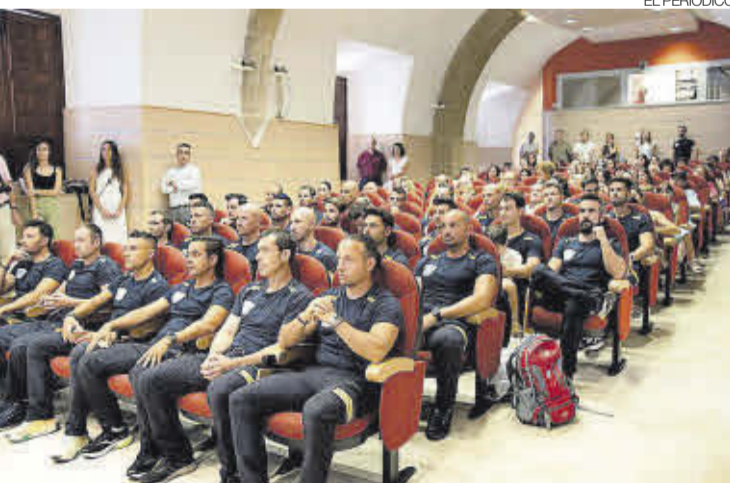
►► Acto de toma de posesión de los bomberos.

Añadió que la diputación lleva mucho tiempo trabajando para mejorar el servicio y destacó que sigue dando pasos para la consolidación del SEPEI y la mejora de los servicios, pudiendo reducir los tiempos de respuesta en todos los puntos de la provincia. Esto con la