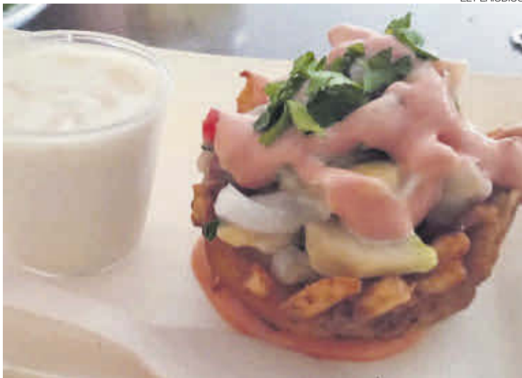
►► Ceviche de langostinos, elaborado por el bar Las Brozas.