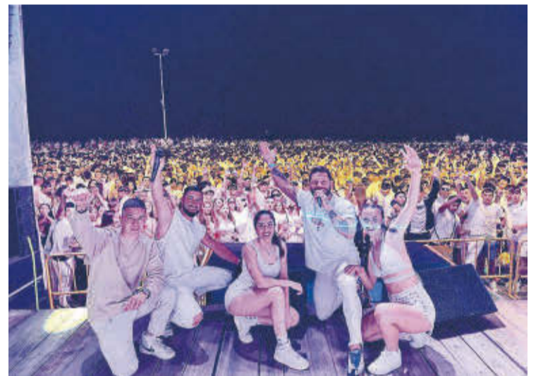
► Artistas que actuaron durante la noche ibicenca.

ESTE AÑO SE HA CUMPLIDO LA XV EDICIÓN Y SE HAN JUGADO UNOS 100 PARTIDOS