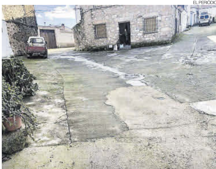
►► El pavimento de la calle Preciados presenta deficiencias.

Las obras están ya adjudicadas a la empresa Buenaventura, S.L. y la inversión será cofinanciada por el ayuntamiento y la Diputación Provincial de Cáceres. ≡