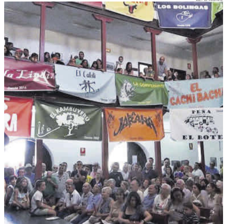
►► Acto para la subasta de carros entre los vecinos.

El día 13 se realizó el Día de la Bici y por la noche actuó el