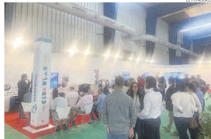
►► Encuentro sobre tecnología organizado por la diputación.

EL PLAZO ESTARÁ ABIERTO HASTA EL 29 DE SEPTIEMBRE