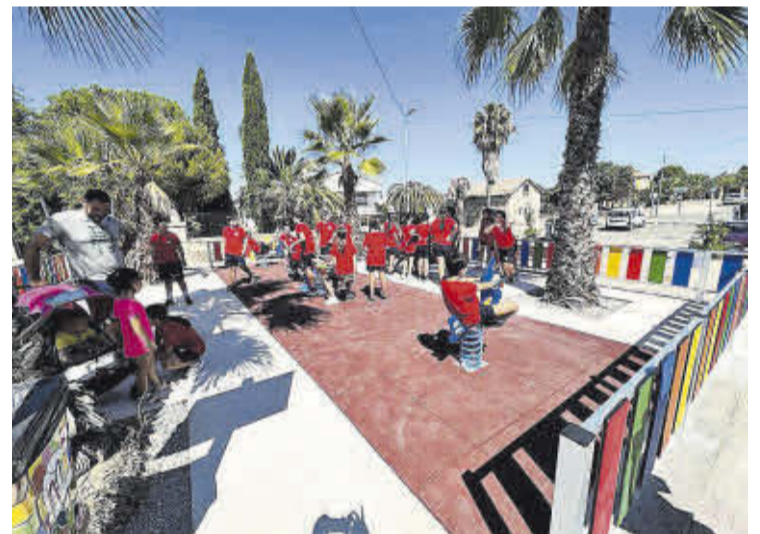
▶▶ Zona habilitada en el barrio residencial Las Arenas.

LA ACTIVIDAD FUE EL 22 DE JULIO E INCLUYÓ ACTUACIONES Y ESPECTÁCULOS