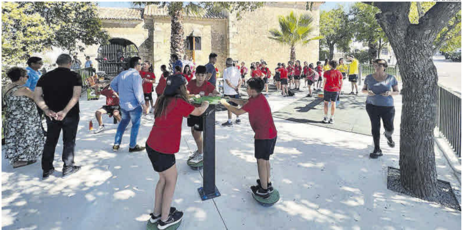
▶▶ Jóvenes y adultos hacen uso de los elementos de gimnasia instalados en las inmediaciones de la Ermita de Santa Ana.

La inauguración tuvo lugar en el marco de la celebración del Día de los Abuelos, ya que el espacio se concibe como un punto de encuentro intergeneracional, con elementos para mejorar la condición física, juegos infantiles y mobiliario urbano. La financiación ha proveniendo de fondos propios municipales y de la convocatoria de ayudas del Plan de Recuperación, Transformación y Resiliencia, de los fondos Next Generation EU. ≡