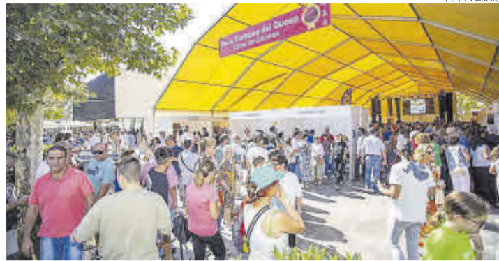
►► Una actividad en torno al queso del Casar, en su edición anterior.

Por ello, en el bando recalcan que «es hora de tomar conciencia y cuidar cada gota de agua restringiendo en lo posible los riesgos con mangueras, las duchas de varios minutos sin cerrar el grifo y tantas y tantas formas que tenemos de ahorrar el consumo de agua». Finalmente recuerdan que el agua «es un recurso vital». ≡