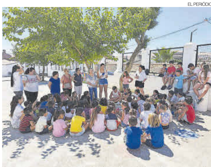
►► I Jornada Intergeneracional entre niños y adultos.

Junto a estos festejos populares, también se ha hecho un gran esfuerzo para impulsar el nivel de las actividades. ≡