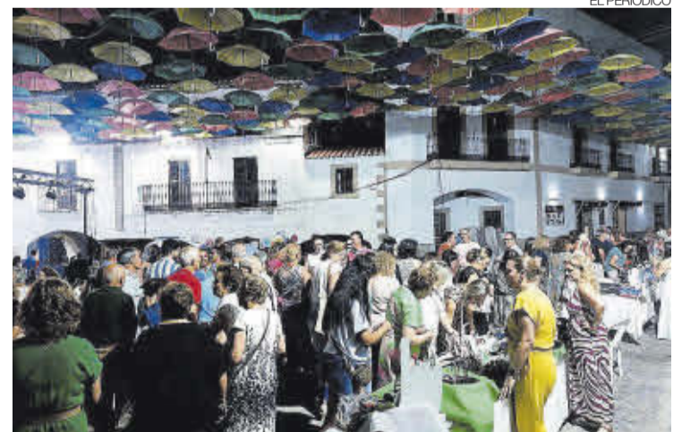
▶▶ Participantes en la Noche del Emprendimiento llena la plaza Mayor.