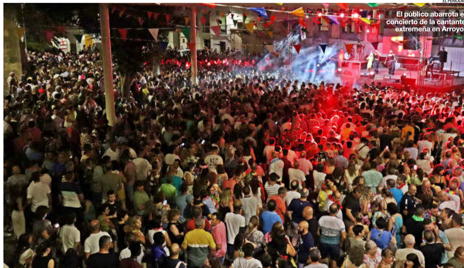
EL PERIÓDICO El público abarrotó el concierto de la cantante extremeña en Arroyo.