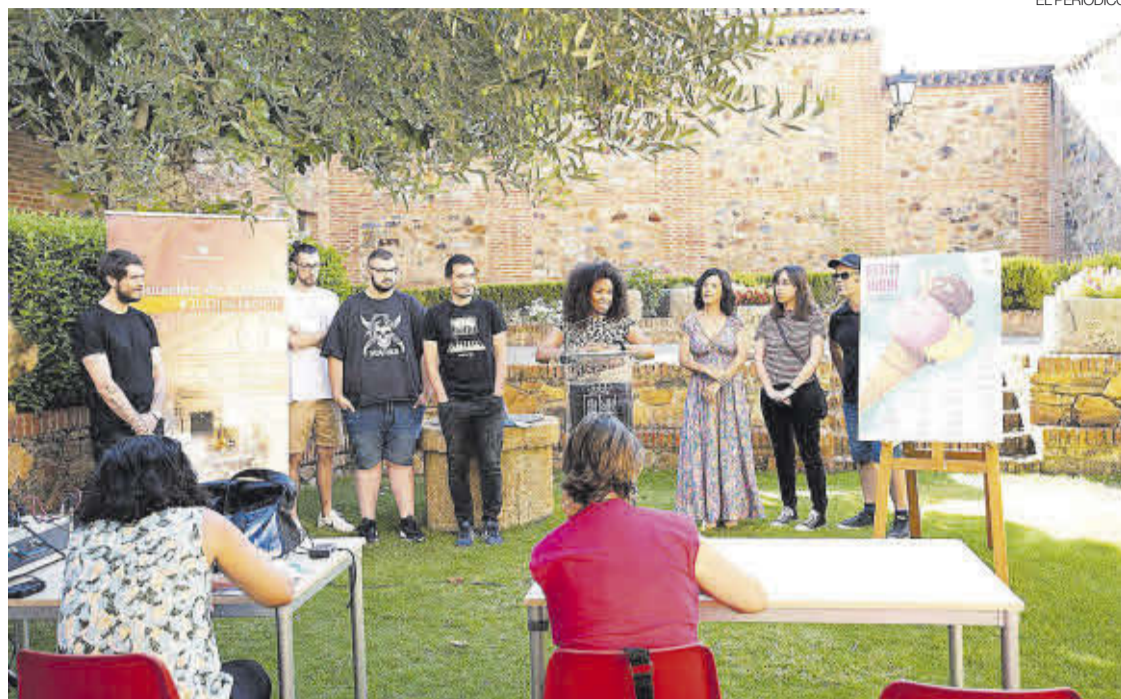
►► Acto de presentación de Estivalia en los jardines del Palacio de Carvajal, en Cáceres.

EL PROGRAMA LLEGA A GARROVILLAS DE ALCONÉTAR E HINOJAL, ENTRE OTROS LUGARES