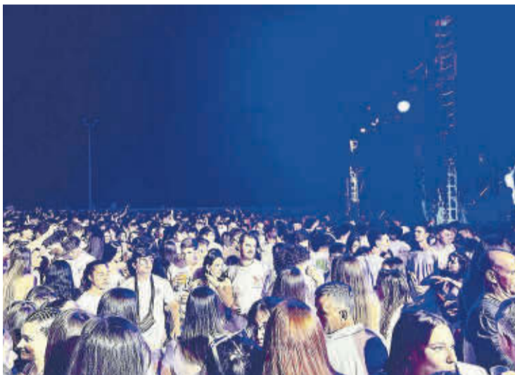
► Esta fiesta resulta un gran atractivo para el público joven.