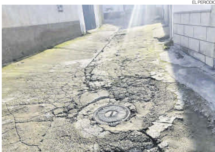
►► El tramo de las alcantarillas y redes también está muy afectado.