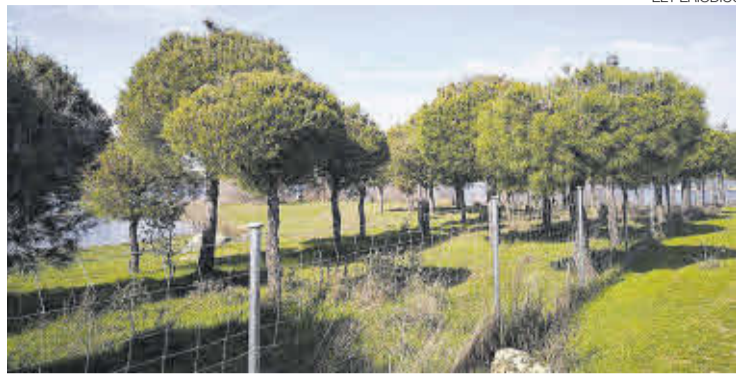
►► Zona verde donde hay un pinar, en el término de Casar.