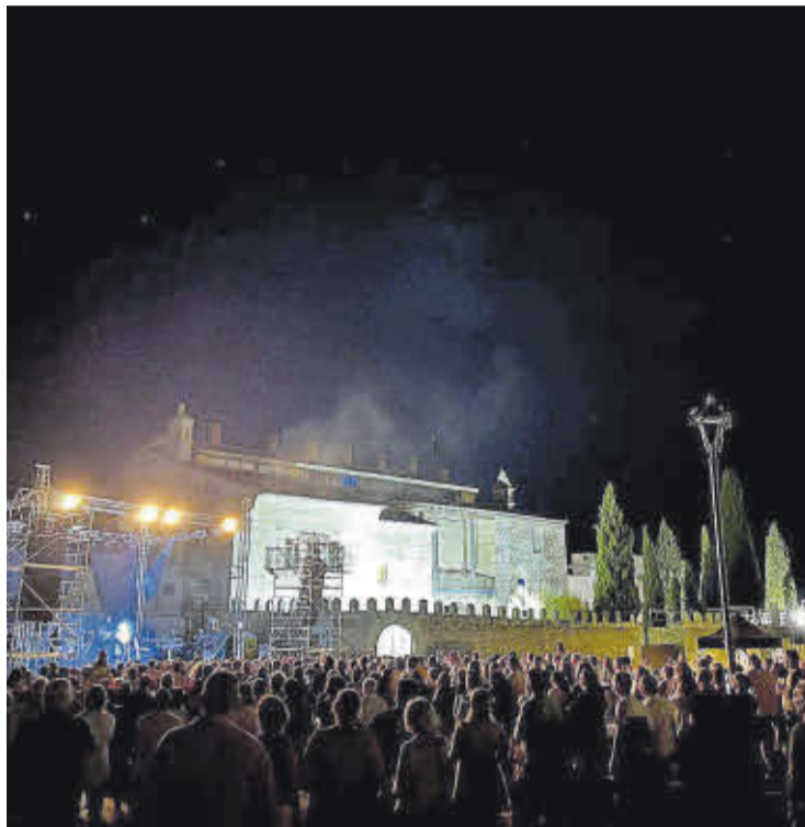
►► Numeroso público asistió al concierto de Medina Azahara.

El programa comenzó con un concierto de Medina Azahara el 4 de agosto. El día 6 se presentó el cartel de los feste-