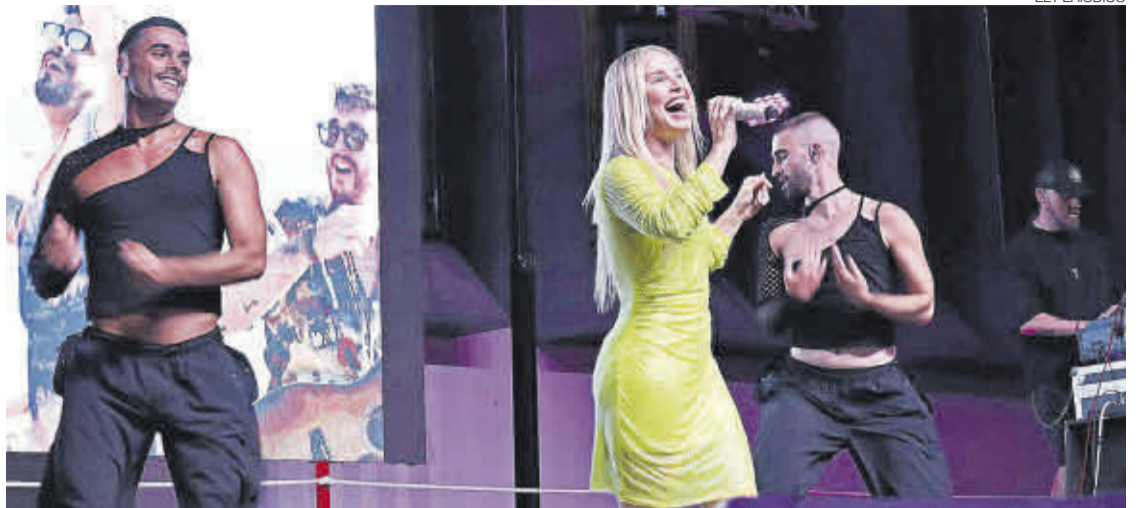
►► Soraya Arnelas, durante su actuación en Arroyo de la Luz, junto a sus bailarines.