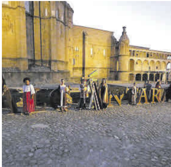
▶▶ Participantes que han hecho de susurradores.

En los días del Festival de Teatro se han susurrado versos y fragmentos de Lope de Vega, Calderón de la Barca y Shakespeare, deleitando a cien-