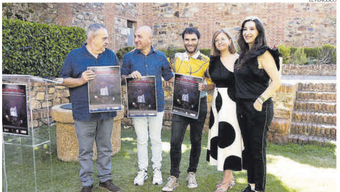
►► Acto de presentación del espectáculo 'De la vida y del querer', que se estrenó en Navas.

De la misma manera, la diputada animó a visitar el Centro de Interpretación de las Escuelas Viajeras del municipio, un centro que pertenece a la Red de Centros de Interpretación de la provincia de Cáceres, por ser una temática muy conectada con las misiones pedagógicas sobre las que se divulga este centro y el proyecto de acercar la cultura a los pueblos. ≡